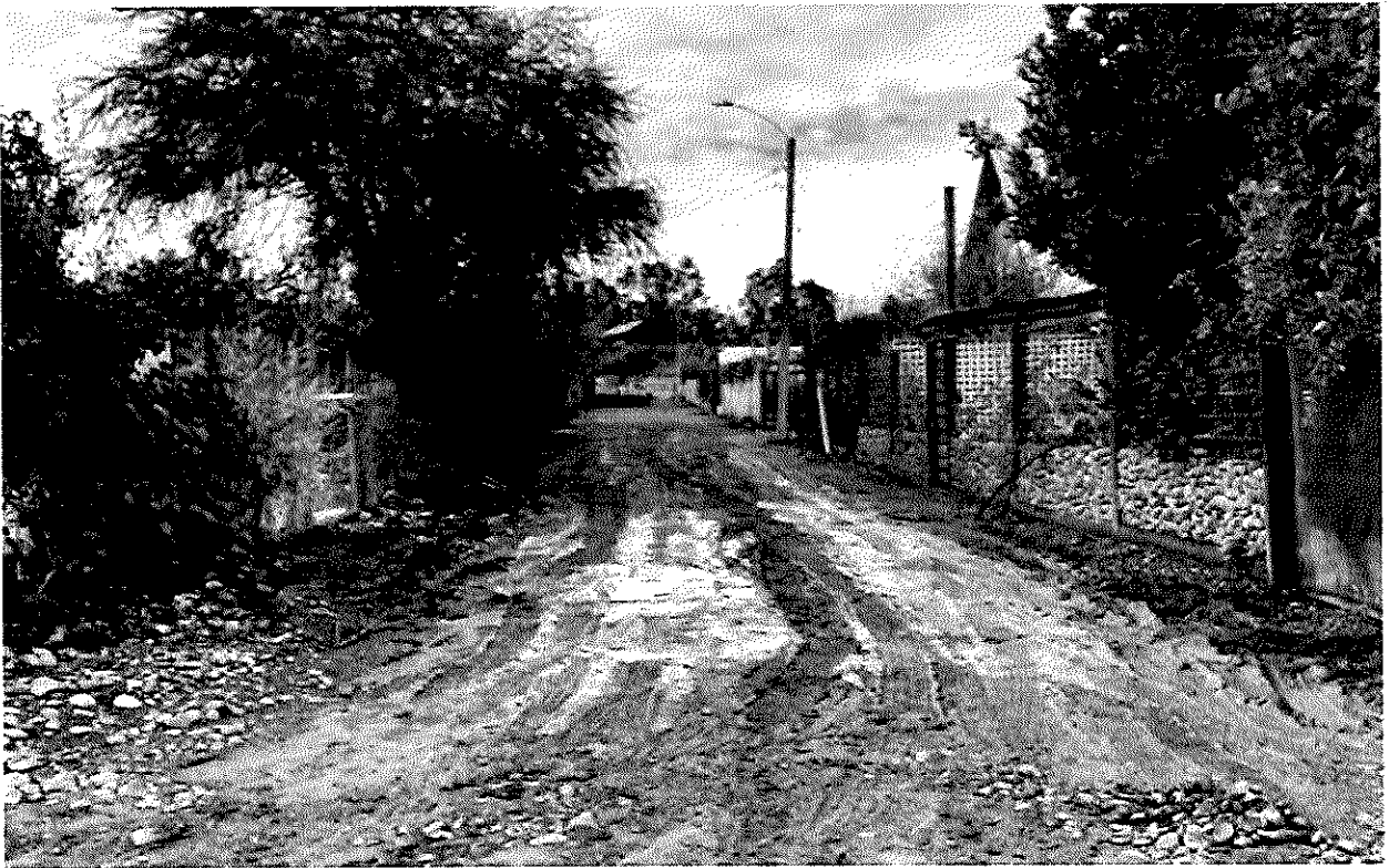
Imagen 13 – Sector Las Villas