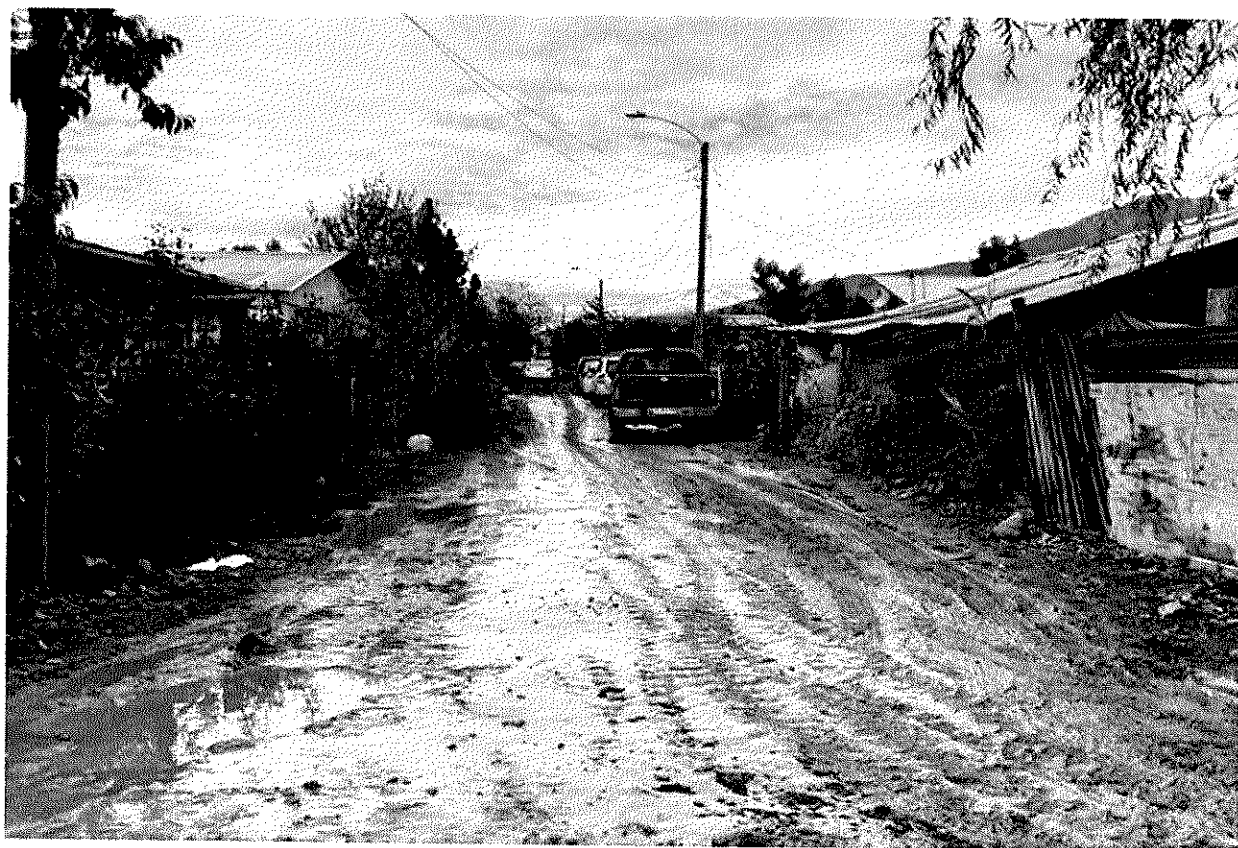
Imagen 12 – Sector Las Villas