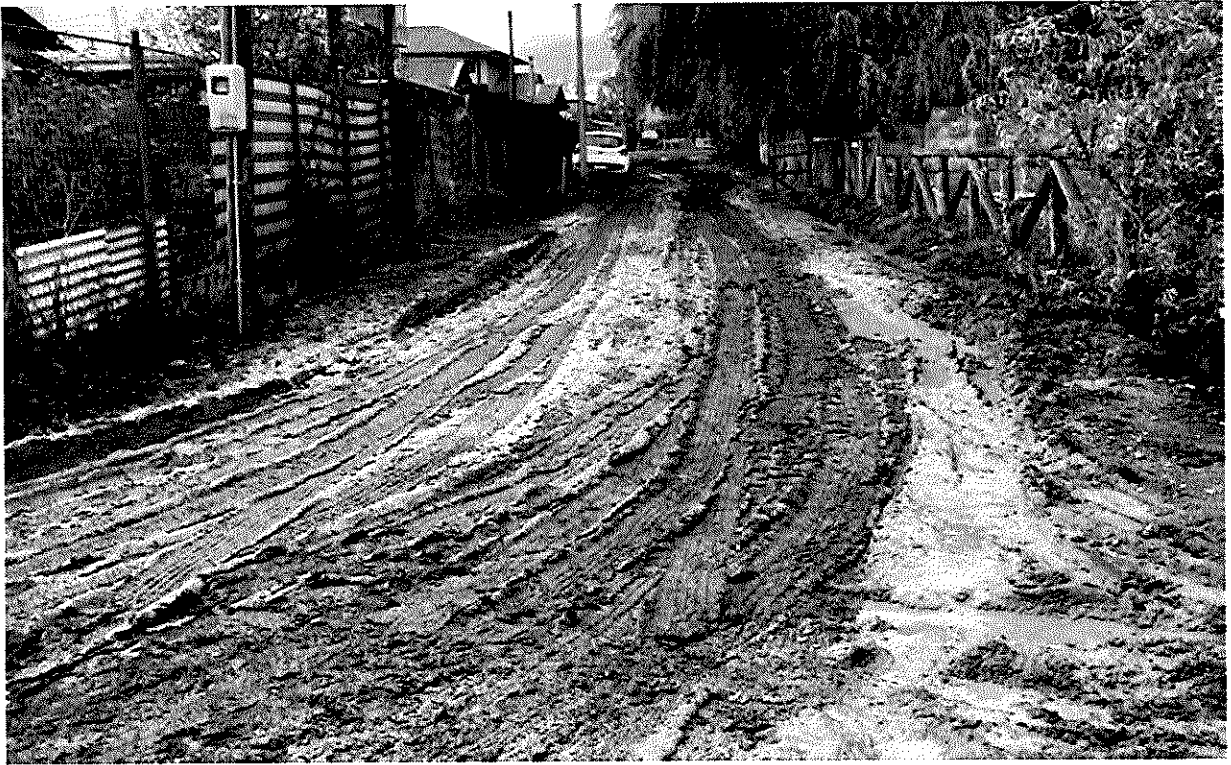
Imagen 5 – Sector Las Villas