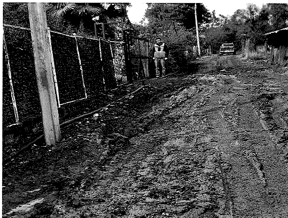
Imagen 20 – Isla de Briones