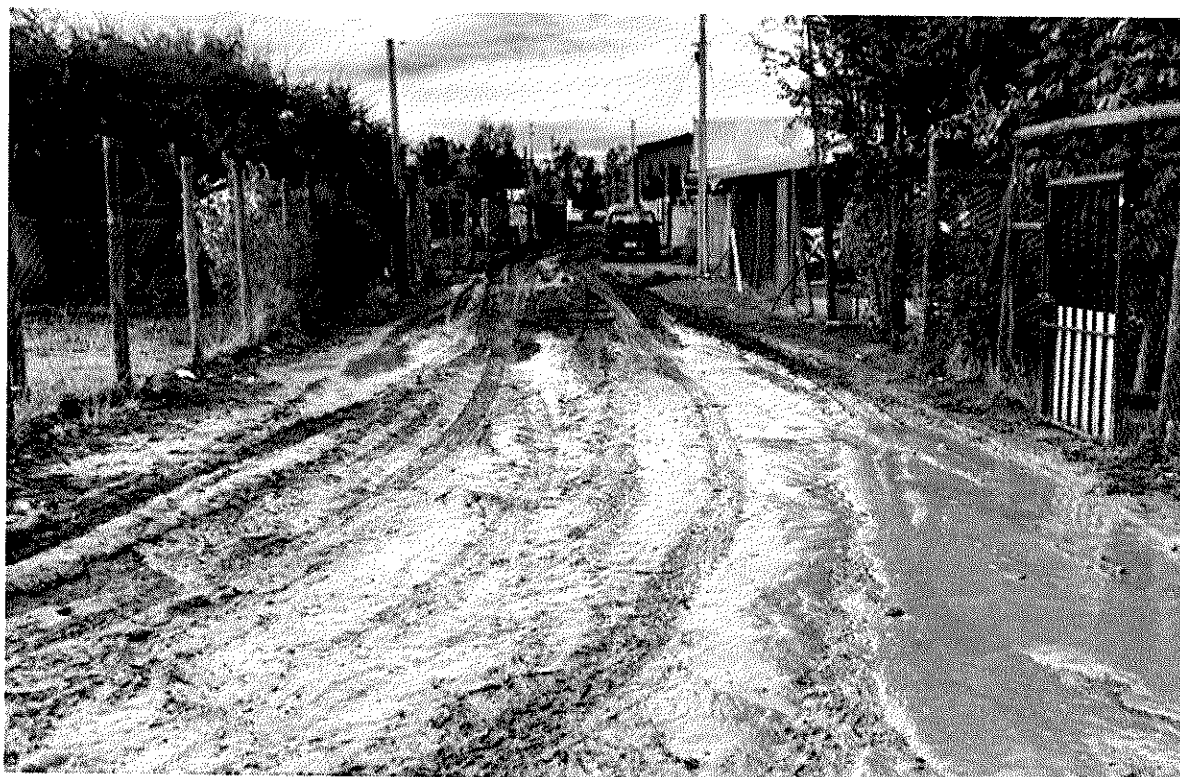
Imagen 7 – Sector Las Villas