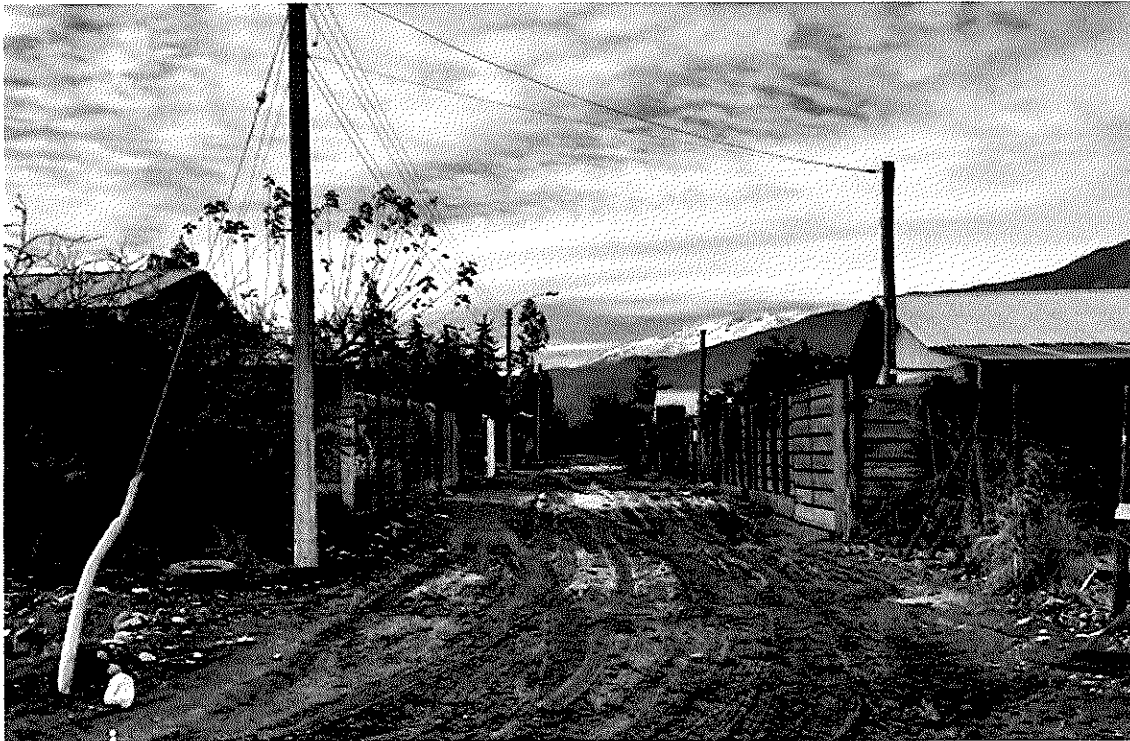
Imagen 2 – Sector Las Villas