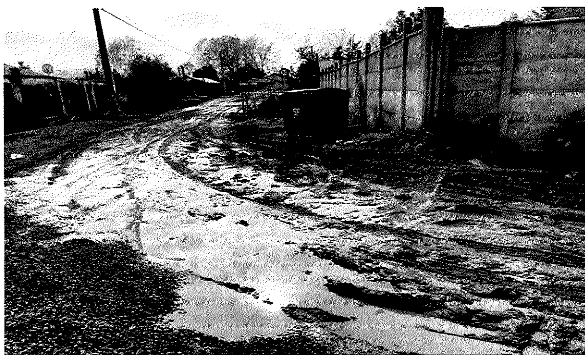
Imagen 16 – Callejón Estadio al fondo