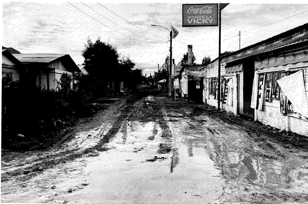
Imagen 11 – Sector Las Villas