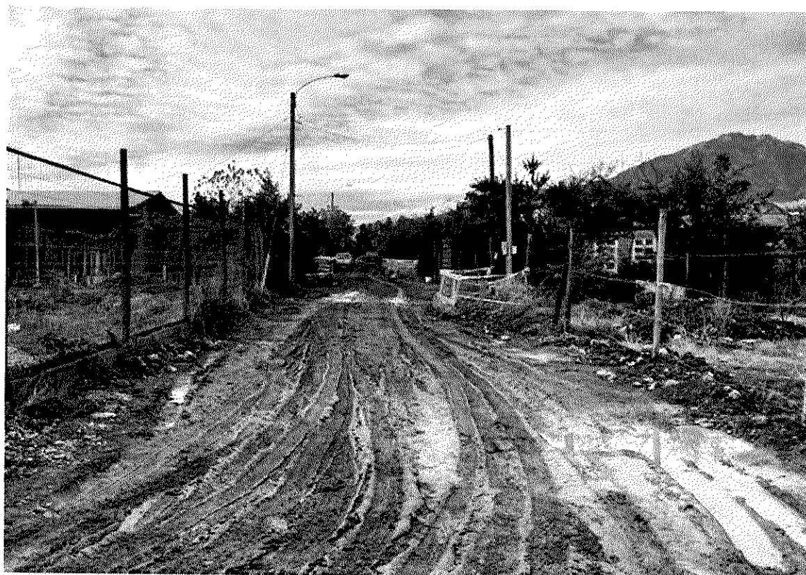
Imagen 4 – Sector Las Villas