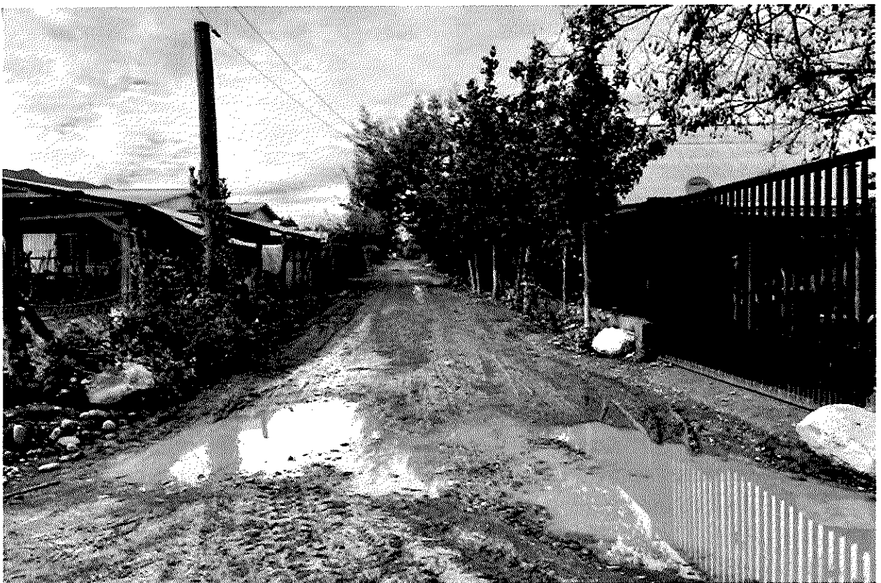
Imagen 14 – Sector Las Villas