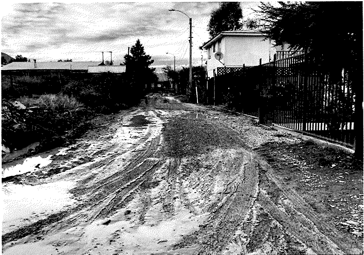
Imagen 6 – Sector Las Villas