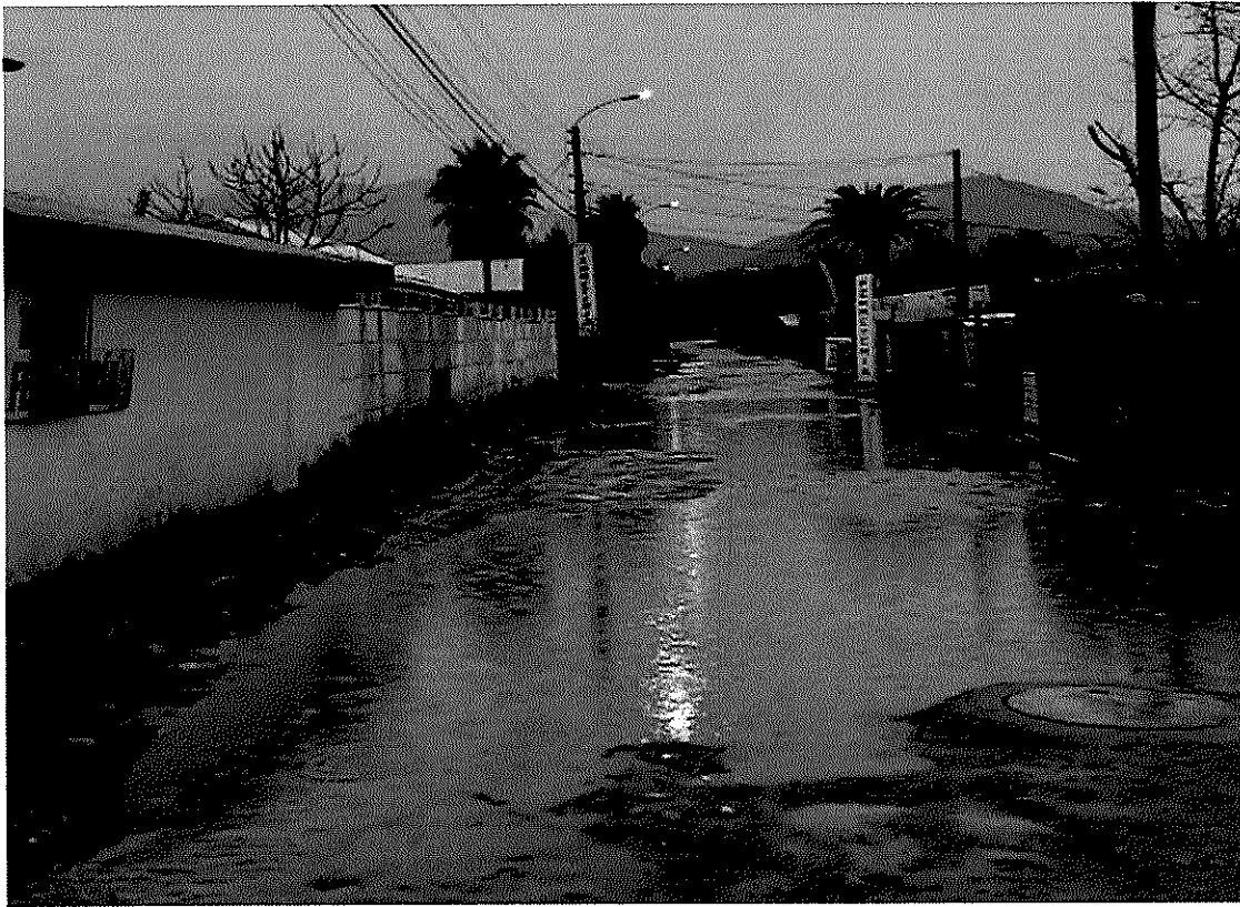
Imagen 1 – Sector Las Villas