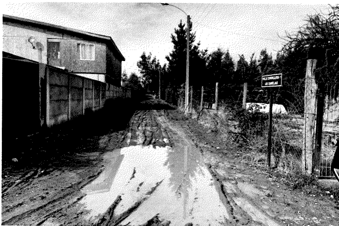
Imagen 17 – Villa Cordillera, Las Camelias