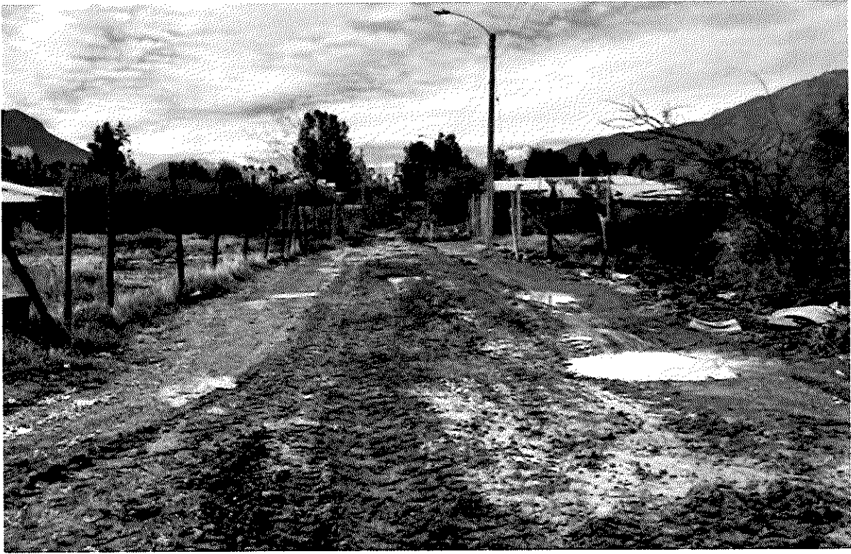
Imagen 9 – Sector Las Villas