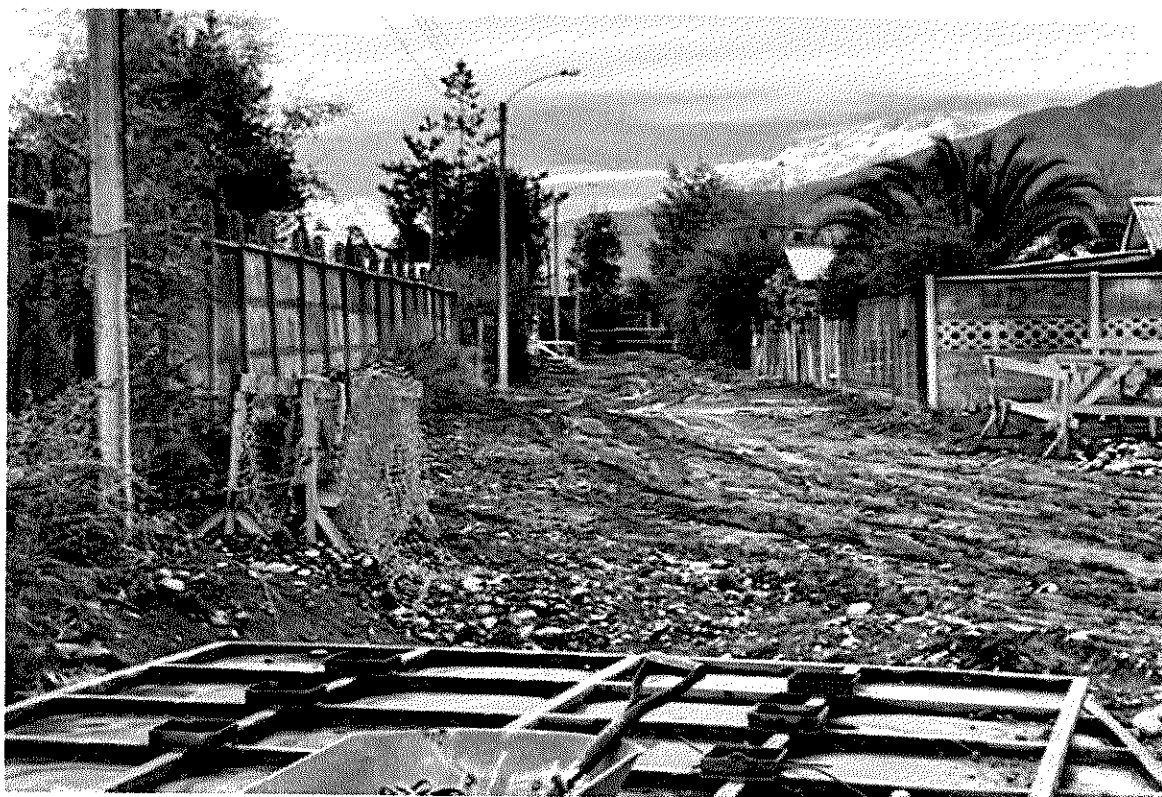
Imagen 3 – Sector Las Villas