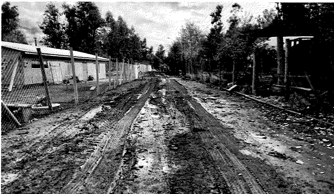
Imagen 19 – Isla de Briones

nosotros hagamos ahora se va a perder. Mientras tanto hemos hecho trabajos de mitigación hasta que logremos arreglar esto, con la nueva Empresa, que va a entrar en el mes de agosto de 2.024. Por lo anterior tuvimos una reunión con Essbio, con Vialidad, con el Gobierno Regional, y la Unidad de Gestión de Riesgo, para analizar esta situación y se optó que la forma más rápida es que lo hagamos como Municipio, con cargo al Proyecto de Transición, es decir al Proyecto que se está financiando con las Boletas de Garantía de la Empresa MONTEC. Comentar también que el I.T.O., de esta obra lo estamos coordinando con la D.O.M., pero el responsable de rendir el Servicio soy Yo.