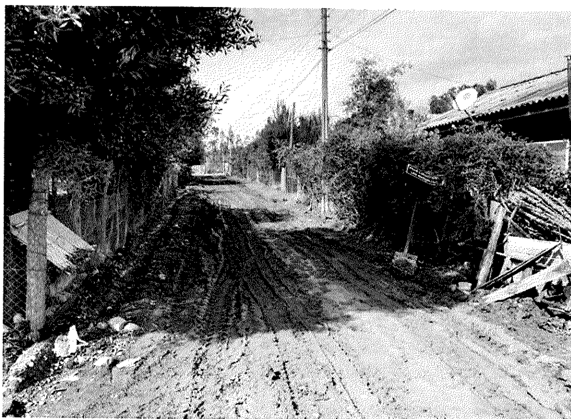
Imagen 18 – Villa Cordillera, Los Magnolios