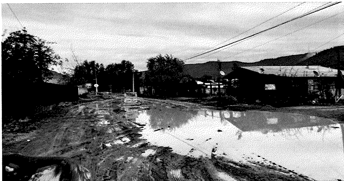
Imagen 15 – Callejón Estadio al fondo